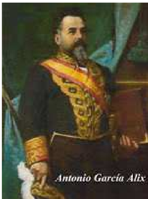
Antonio García Alix

Diario N° 4. Museo Pedagógico y del Niño de Castilla-La Mancha. Albacete