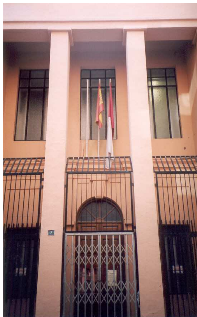
Fachada del antiguo Colegio “General Primo de Rivera”, propuesto en su día para la sede del Museo.

Creemos que el patrimonio arquitectónico de Albacete se ha visto esquilmo a lo largo del siglo XX, quedándonos muy pocos edificios emblemáticos del pasado. Por esta razón, y sobre todo porque es uno de los escasos ejemplos de construcciones escolares de la primera mitad del siglo pasado que nos quedan, habría que salvar esta construcción.