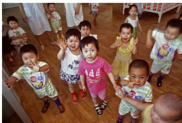
Orfanato en China. www.jonchase.com

Para saber más: Informe Mundial sobre la Infancia. UNICEF