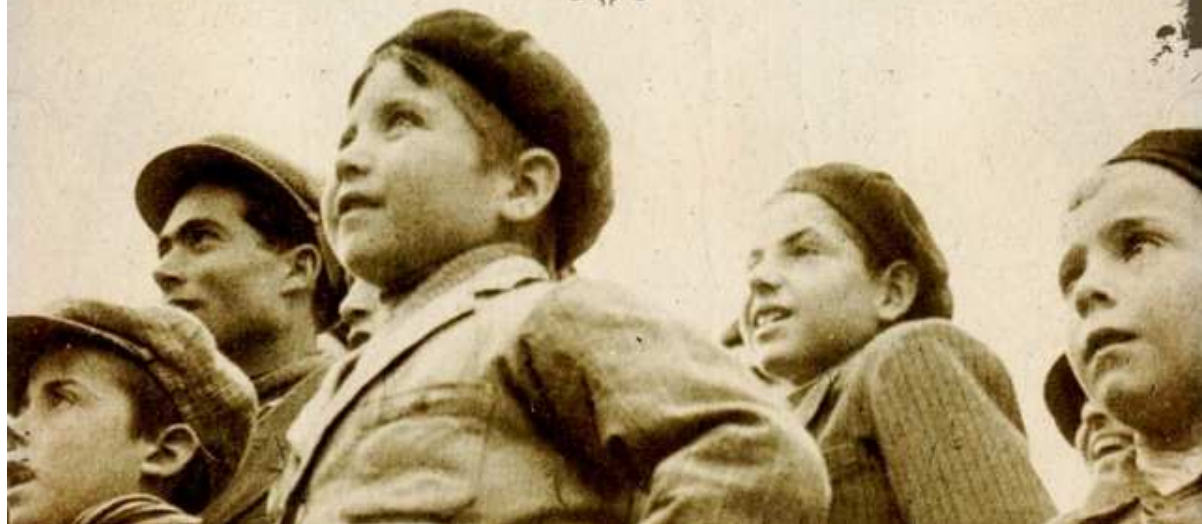
Panel de la Exposición "Más cuento que Calleja" organizada por la Asociación "Amigos del Museo del Niño" en el año 2009