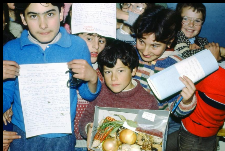
Taller de Texto-Libre y Correspondencia escolar Arriba: Escuela de Freinet. Francia. Años 50. S. XX Abajo: Escuela de Tiriez (Albacete). Años 80. S. XX