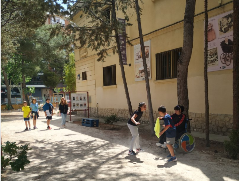
Juego del pañuelo en la zona ajardinada del Paseo de los Escolares (fachada del MUNI)