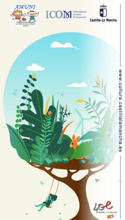
Cartel oficial de la JCCM