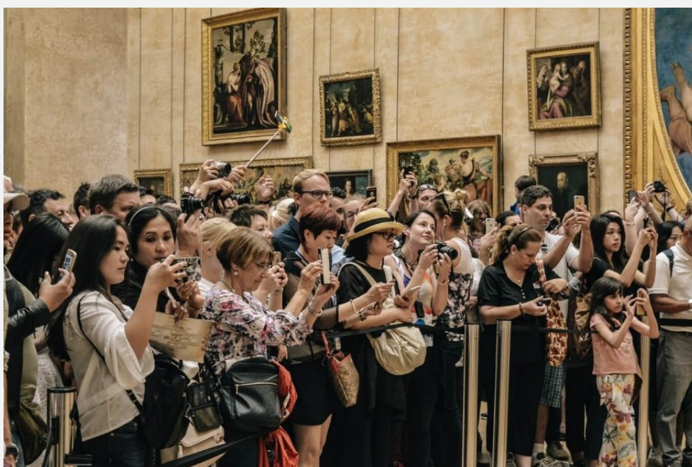
Visitantes en una sala del Museo del Louvre

Si el lector ha visitado alguna de esas exposiciones de las llamadas del “siglo”, tanto en nuestro país como en el extranjero, habrá podido comprobar cómo multitud de personas, con el móvil en la