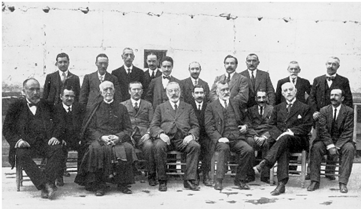
Claustro de Profesores del Instituto de Albacete en su antigua sede de la C/ Zapateros

ESCRITO DE LA JUNTA INSPECTORA DEL INSTITUTO DE ENSEÑANZA MEDIA SOBRE LA LAMENTABLE SITUACIÓN ECONÓMICA EN QUE SE ENCUENTRA. (Albacete, 3 de marzo de 1849)