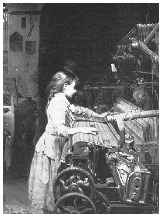
La tejedora. J. Planella. Barcelona

Al desinterés de algunas autoridades municipales y nacionales por la educación, contribuía también la opinión de muchas familias campesinas que consideraban la escuela una pérdida de tiempo, pues, cuando los estómagos están vacíos, lo primero que hay que hacer es llenarlos y después pensar en el alimento intelectual. Por este motivo, muchos niños eran dedicados a realizar faenas de todo tipo, sobre todo en el campo y en la incipiente industria.