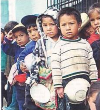
Uno de los principales factores es la pobreza.

ACCIONES. Desde el 2015, la Diresa propone la implementación de estrategias múltiples con la intervención de diversos sectores regionales más el soporte del Midis, la implementación del Centro de promoción y vigilancia comunal, espacio comunitario que