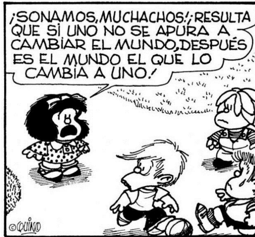
Cómic de Mafalda. Autor: Quino