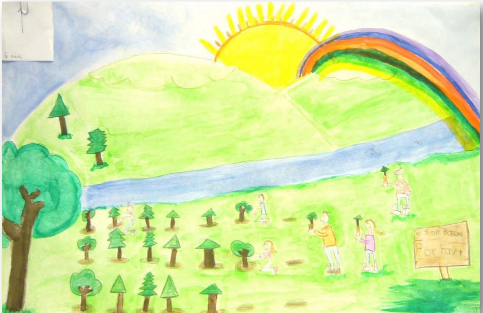
A partir de los 14 años. Representación espacial. El niño utiliza la profundidad y la perspectiva.