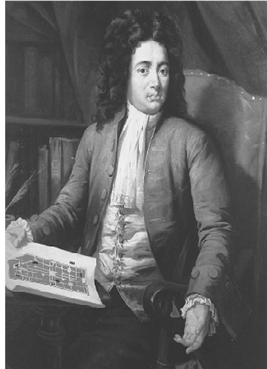
Melchor Rafael de Macanaz. Primera mitad del s. XVIII

ilustrado es considerado como el gran unificador y reformador del poder de la corona, y, a pesar de ello, fue abandonado por Felipe V a la hora de enfrentarse con el poder de la Iglesia. Se exilió a Francia y, cuando volvió a nuestro país fue encarcelado durante doce años, casi hasta su muerte.