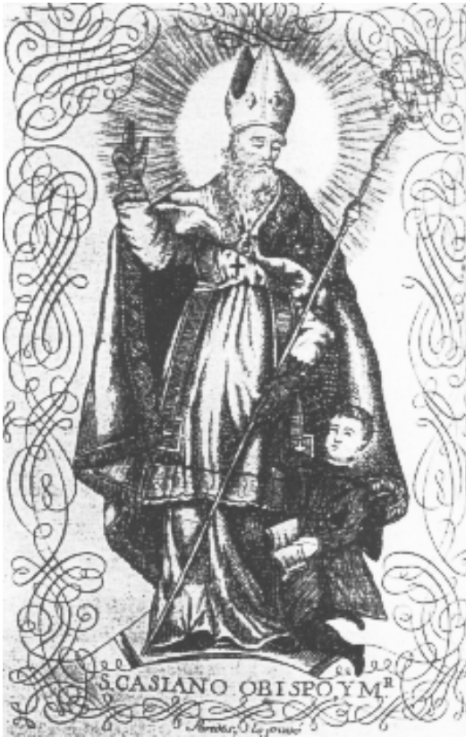
San Casiano, obispo y mártir, patrón de los maestros en el siglo XVIII.

siano a todos aquellos que deseen enseñar a los niños en sus respectivas villas.