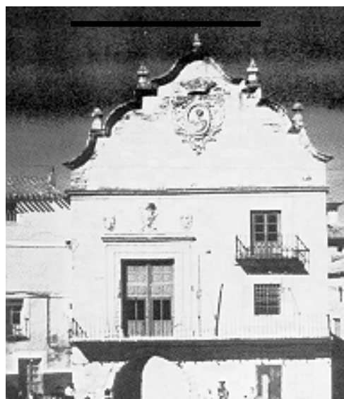
Fachada del Ayuntamiento de Chinchilla